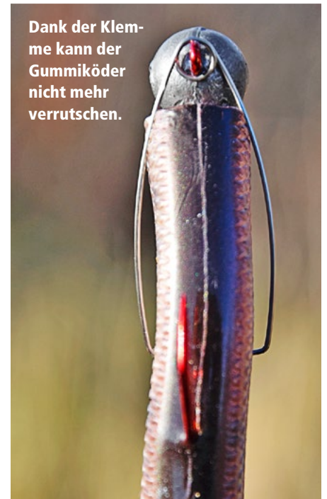
Dank der Klemme kann der Gummiköder nicht mehr verrutschen.

mus im Stile eines Korkenziehers. An jedem der Bleiköpfe befindet sich ein kleines Kunststoffschraubchen und eine kleine Drahtspirale. Man zieht den Gummiköder wie gewohnt auf, schiebt ihn aber nicht bis zum Ende durch, sondern drückt leicht von hinten, während man mit der anderen Hand am Schraubchen dreht und die Drahtspirale ins Gummi treibt. So hält der Köder gut am Haken.