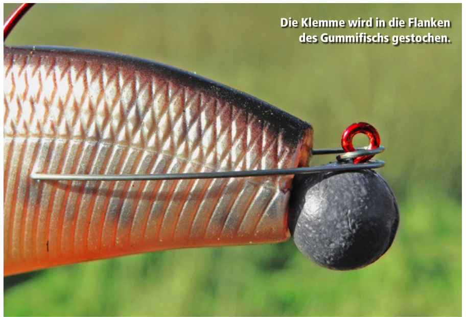
Die Klemme wird in die Flanken des Gummifischs gestochen.